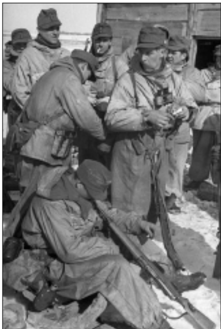
Немецкие горные егеря

взбешенные гитлеровцы открыли сильный пулеметный огонь по своей же базе... Так с нею было все кончено. Командир дал команду отходить.