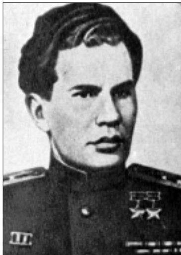
Дважды Герой Советского Союза В.Н. Леонов

К исходу дня наше положение стало очень тяжелым. Боезапас подходил к концу. Фашисты, понимая, что ночью мы попытаемся вырваться из окружения, предприняли еще одну яростную атаку. Против наших позиций они установили два пулемета и стали поливать настильным огнем маленькую площадку, которую мы занимали, лишая возможности поднять голову.